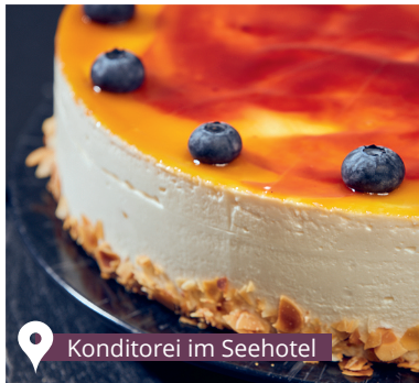
Konditorei im Seehotel