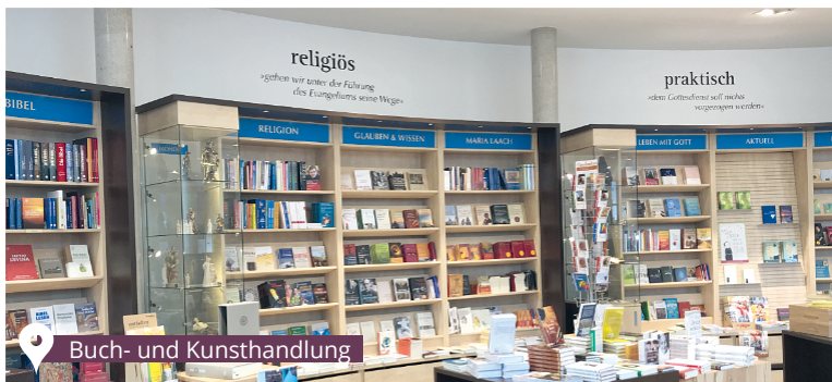
Buch- und Kunsthandlung