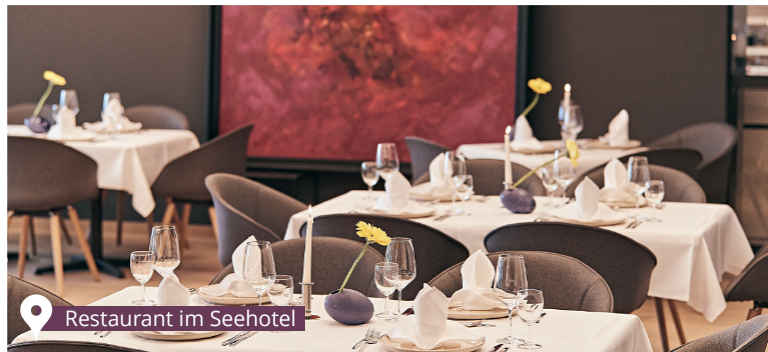
Restaurant im Seehotel