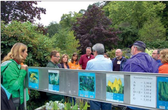
In der Klostersgärtnerei gab es Tipps für die Pflege und Auswahl von Wasserpflanzen.