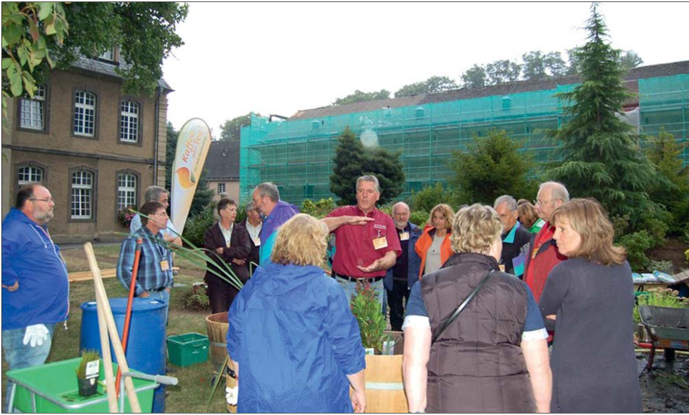
Die Teilnehmer des Workshops lauschten gespannt den Anweisungen der Gartenexperten.

Der SWR hatte zu einem Gartenworkshop eingeladen