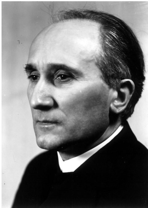
Romano Guardini 1885–1968